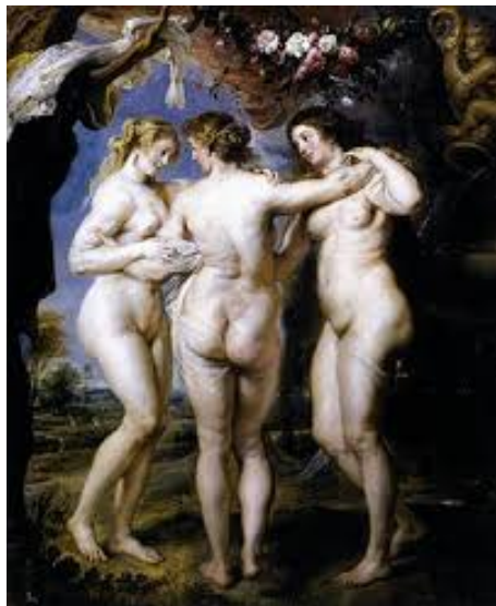
Las Tres Gracias (Rubens)